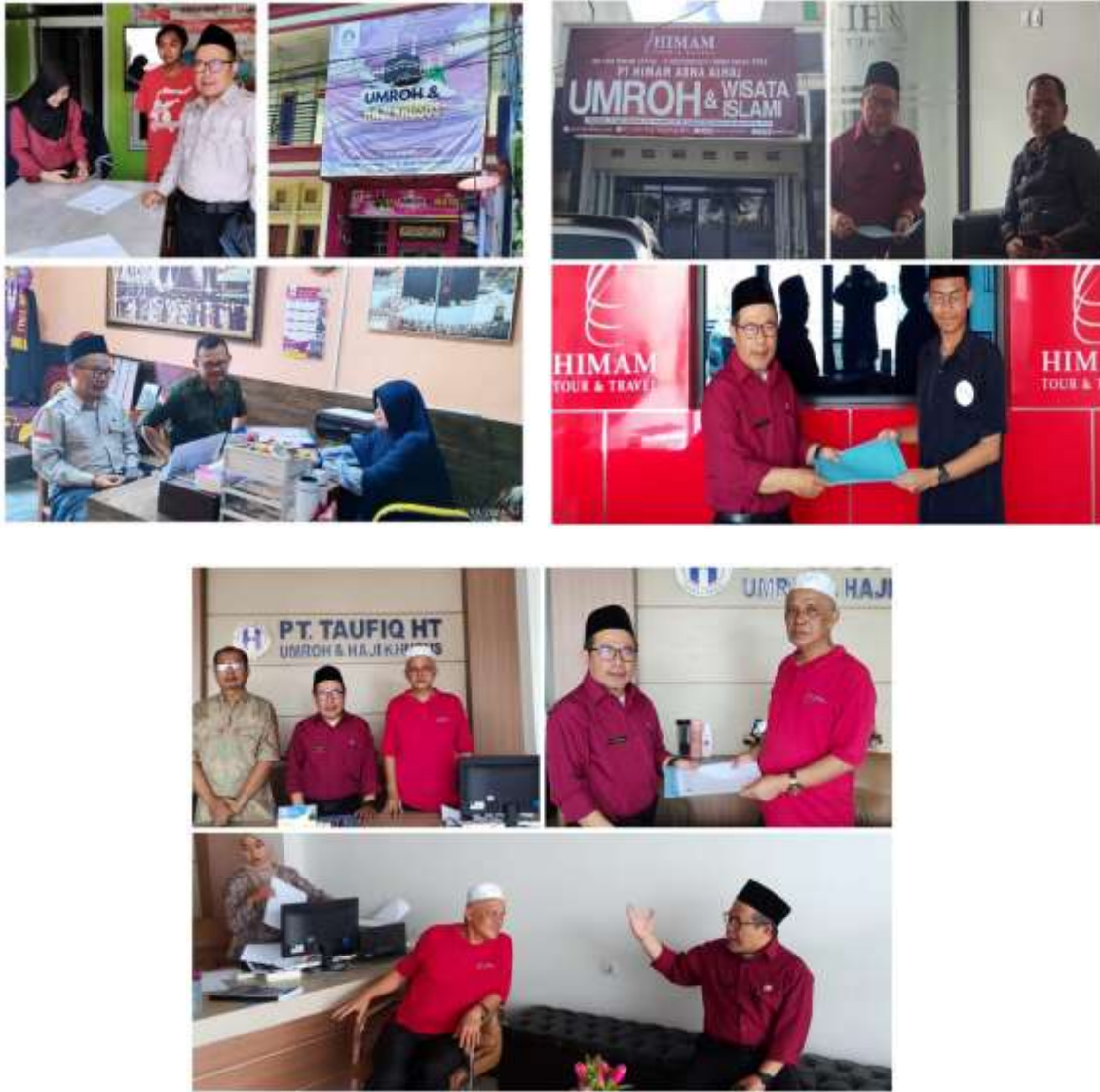
Gambar 1. Pembinaan dan Pengawasan PPIU